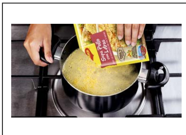
Sopa de sobre