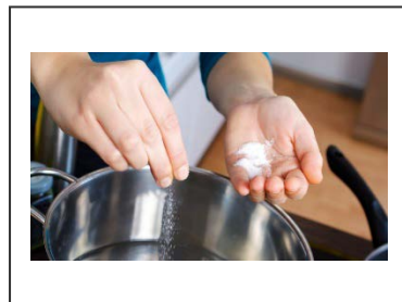
Sal en la comida