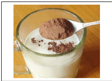
Cacao en polvo en el desayuno