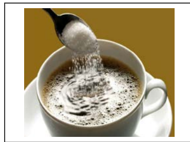
Azúcar en el café